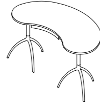
TREE TABLE / 909