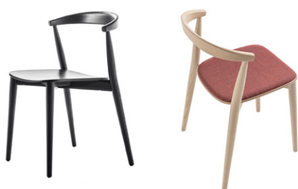
Newood Light chair

Newood Light stool is available in two heights and is made of solid ash wood, in the same tones as the other seats in the collection.