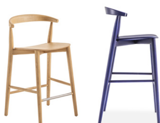
Newood Light stools